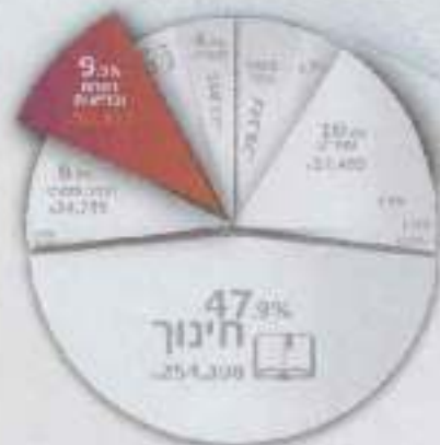
* ייצוגית לנתונים המסומנים