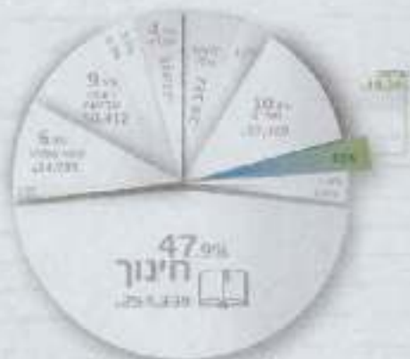
נתונים מועצה ארצית להנדסה