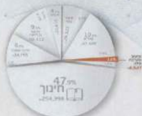
* השוואה עם בסיס נתונים