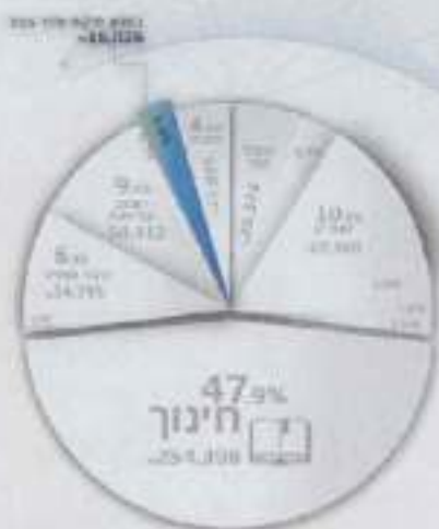
תקציב הביטחון והאבטחה 2025