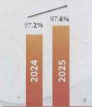
עליה בזכאות לבגרות

השקעות בתוכניות חדשנות ייחודיות לעיר (מעבר לתקציב משרד החינוך) בהיקף של כ-30 מיליון ₪: