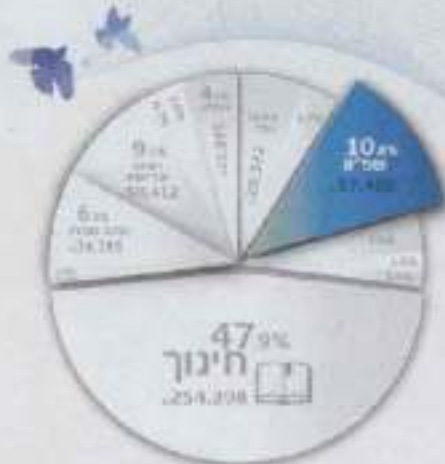
* יציאה לשינון ופיקוח

גידול בעלויות תפעול ואחזקה של כ-3.4 מיליון ש"ח