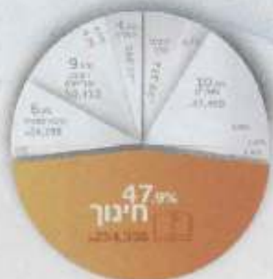
ליצאת ממוסדות חינוך