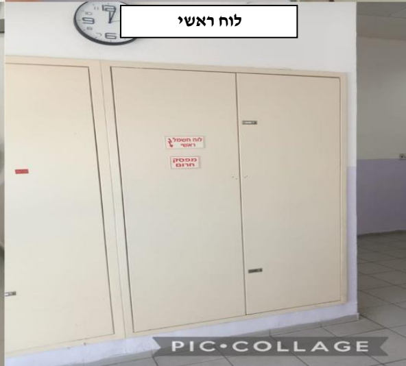
מרכז חוגים סביונצ'ג, ברקת 21, נס ציונה