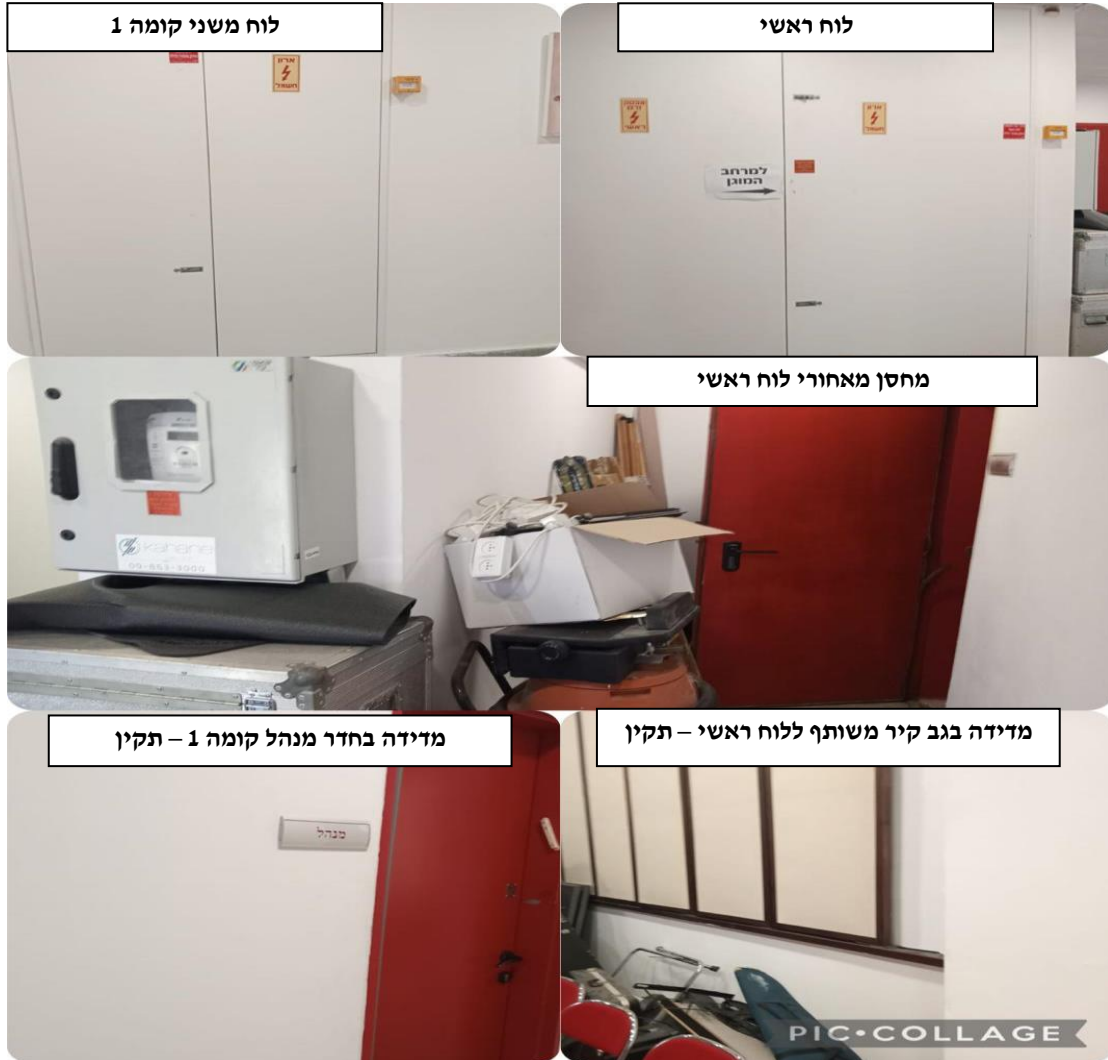
קונסרבטוריון, אוסקר שינדלר, נס ציונה