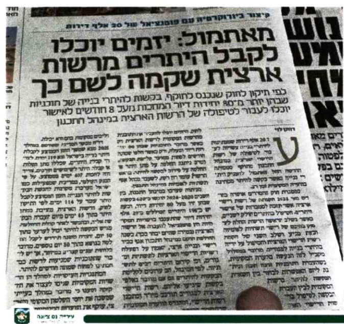
פורסם בכלכליסט 2.7.24

ע"פ חוק - מינהל התכנון רשאית להנפיק היתרי בניה ללא הרשות